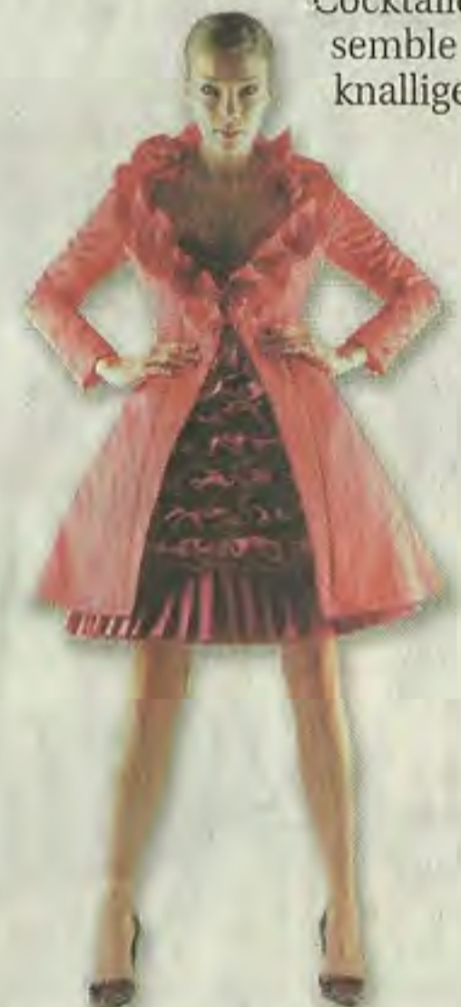
Modell Anibas: Cocktail-Kreation in Pink & Orange aus edlem Satin