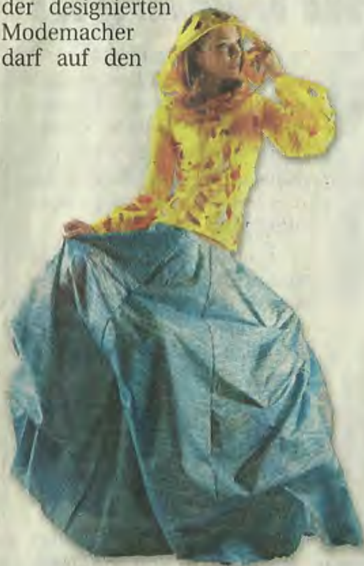
Modell Rosenlechner: Farbenprächtig, mit Heliumballons unterm eisblauen Rock